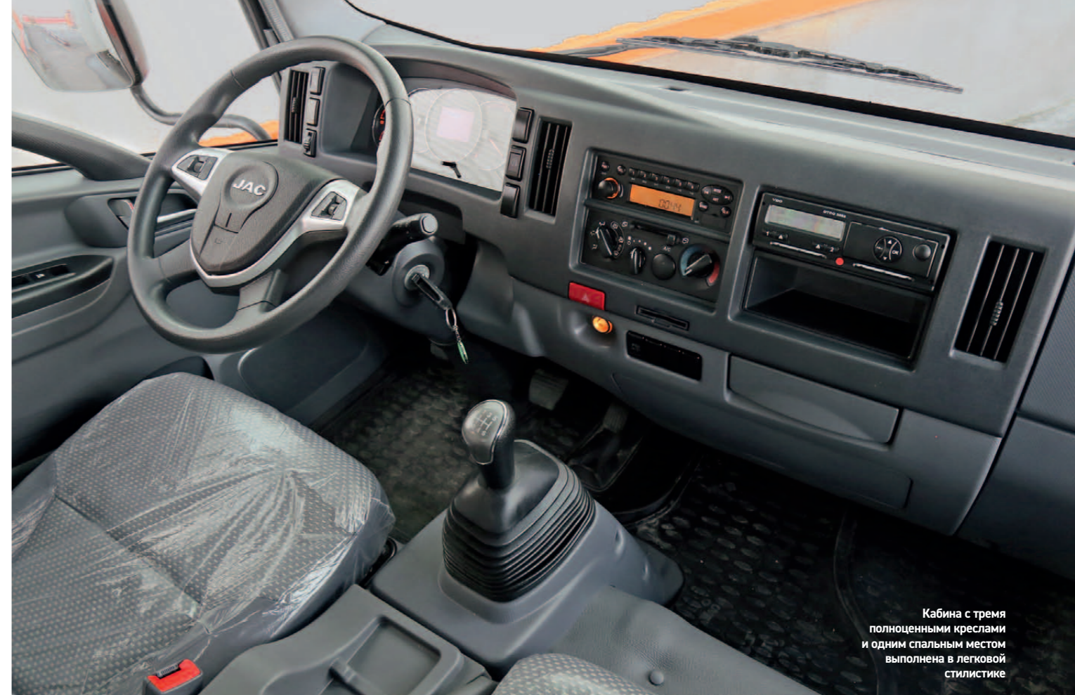
Кабина с тремя полноценными креслами и одним спальным местом выполнена в легковой стилистике

С момента дебюта на российском рынке летом 2012 года грузовые автомобили китайской государственной компании JAC неуклонно набирают популярность. Первоначальный естественный интерес к китайской продукции с оптимальным соотношением цены и качества лишь усилил начавшийся в 2014 году экономический кризис. Покупатели к этому моменту успели убедиться в преимуществах моделей JAC – их экономичности, маневренности, надежности конструкции и приспособленности к российским условиям эксплуатации. Да и официальный российский дистрибьютор «Джак Автомобиль», что называется, не сидел все эти годы сложа руки. Число официальных дилеров марки перевалило уже за три десятка, а в середине 2016-го был налажен выпуск моделей N-56 (полной массой 5,6 т) и N-75 (полной массой 7,49 т) в Казахстане. Наконец, примерно в это же время подоспела «артиллерия среднего калибра» – современный 12-тонник N-120, который пока импортируется из Китая.